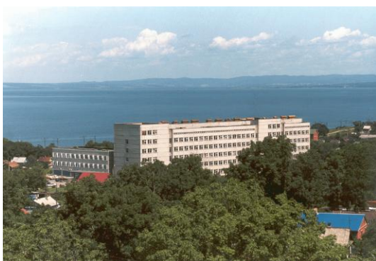
ТОИ ДВО РАН

Место проведения конференции – ФБГУН Тихоокеанский океанологический институт им. В.И. Ильичева ДВО РАН